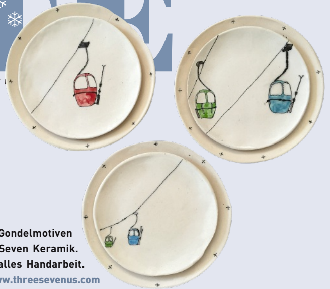
Teller mit Gondelmotiven von Three Seven Keramik. Auf Bestellung, alles Handarbeit.

isabella.klausnitzer@kurier.at ■ www.isatrends.at ■ Twitter: @isaklausnitzer